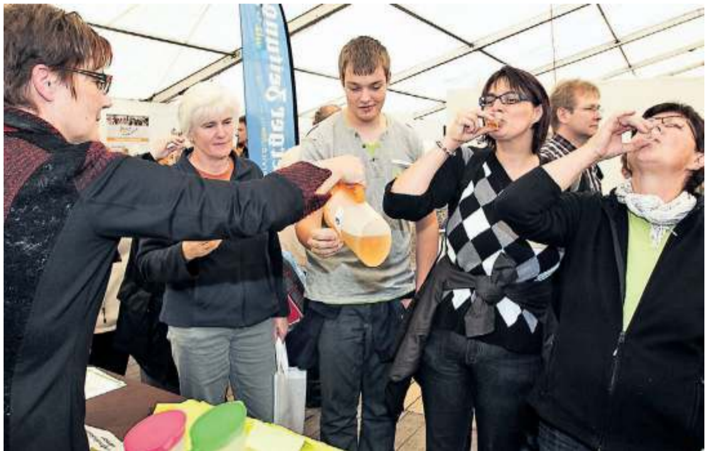
Gutes aus der Region gab es am Wochenende überall bei der Burgwaldmesse zu entdecken. Beim Waldeck-Frankenger Stand konnten Besucher Geschmacksunterschiede bei Apfelsäften testen.