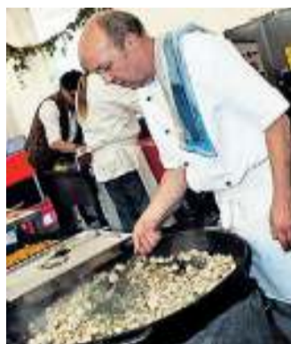
Pilze, Pilze und mehr gab es im Gastronomie-Zelt.