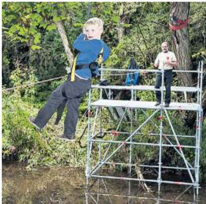
Auch ein Renner: die Seilbahn über die Eder.