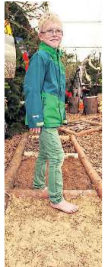
Viel zu erfüllen gab es auf dem Barfußpfad.