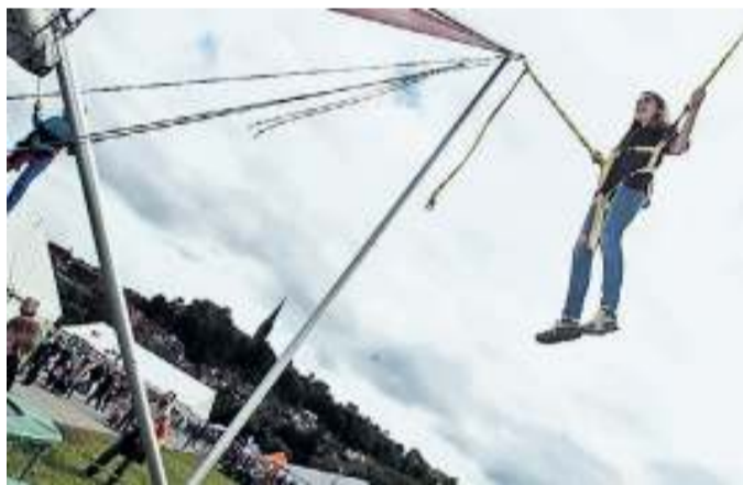
Hoch hinaus: Hochbetrieb herrschte beim Trampolinspringen mit Blick auf die Liebfrauenkirche.