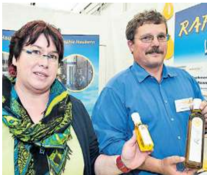
Wieder mit dabei: das Team der Hauberner Rapsmühle.