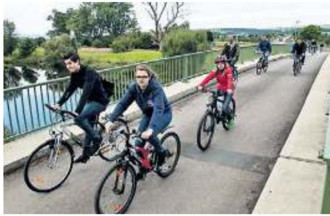
Gestern Vormittag nahmen zahlreiche Radler an der Sternfahrt zur Burgwaldmesse teil.